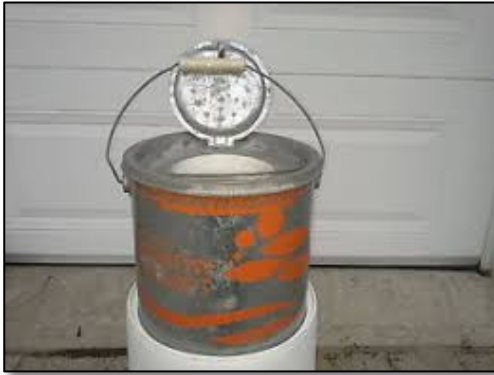
Équipement désuet !!!!!

Nous vous rappelons que, depuis le 1 er avril 2017, le Ministère des Forêts, de la Faune et des Parcs (MFFP) a mis en force le règlement interdisant l'utilisation des poissons appâts vivants ou morts (ménés).