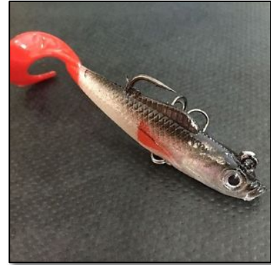
Leurre «imitation» de méné ! C'est permis !

L'interdiction d'utiliser les poissons appâts est une mesure qui vise à protéger nos lacs qui pourraient être contaminés par l'introduction d'espèces indésirables. En interdisant totalement l'utilisation de ménés, on élimine complètement la possibilité de contamination d'un lac à l'autre. Bien sûr on pourrait penser que les ménés capturés dans notre propre lac ne sont pas nuisibles, mais le règlement ne fait pas de distinction, pour simplifier le contrôle et l'application du règlement. Ainsi, même les ménés que vous pourriez capturer dans notre lac sont interdits comme poissons appâts.